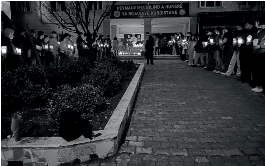
Die Kunsthochschule in Derîk erinnert an den Widerstand und die Gefallenen von Sheikh Maqsoûd und Ashrafiyeh. 12. Januar 2026