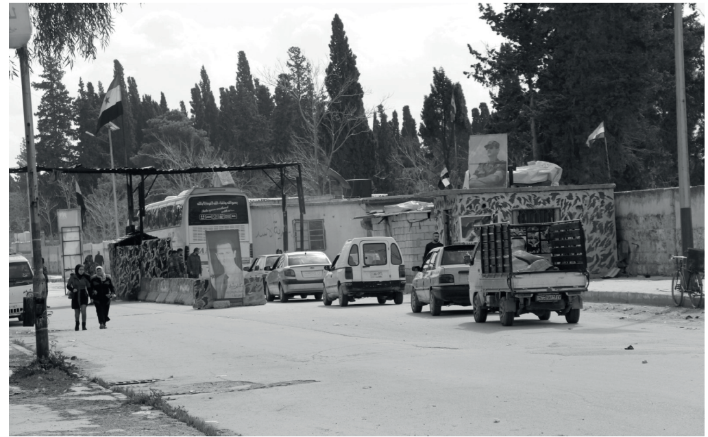
Die kurdischen Stadtteile standen sowohl unter dem Assad Regime als auch unter der HTS unter einem ständigen Blagerung- und Blockadezustand. Januar 2023