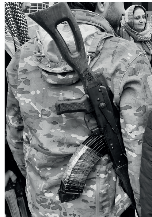
Die Bevölkerung ist bereit sich und die Errungenschaften der Revolution zu verteidigen. Januar 2026

Für die Viertel in Aleppo gilt das Selbe, wie auch für Afrin und Serêkaniyê: Rückkehr der Vertriebenen, Aufbau lokaler Verwaltungsstrukturen, Schaffung von lokalen Polizeikräften unter dem Dach des Innenministeriums, gebildet aus der lokalen Bevölkerung. Der Großteil der Bevölkerung ist in die Viertel zurückgekehrt.