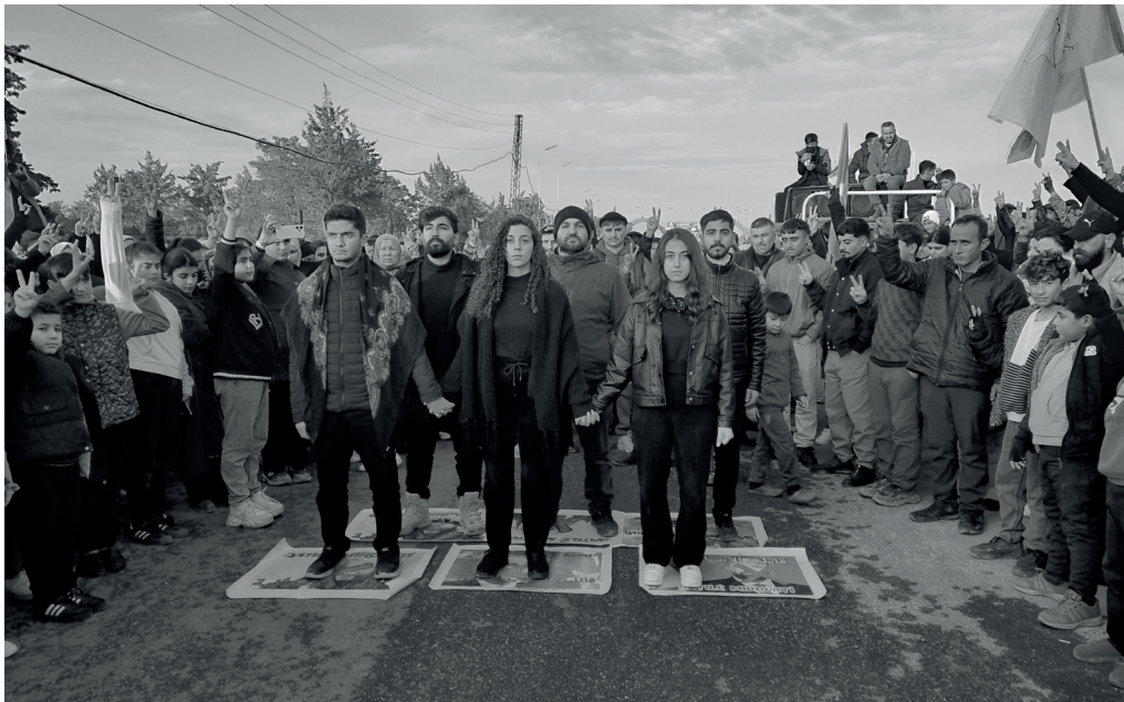
Protest Aktion von Studierenden der Kunsthochschule in Derîk. 10. Januar 2026