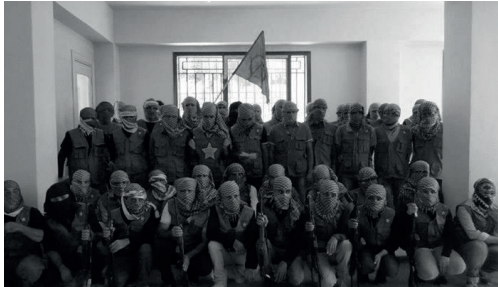
Das erste Battalion der YXK Verteidigungseinheiten in Aleppo. Juni 2011